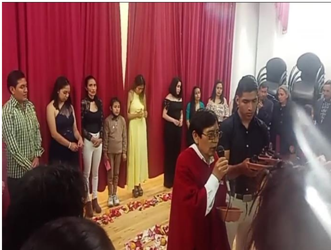
Ceremonia de Clausura

El reconocimiento a la importancia de la lengua materna como es el kichwa, contribuye a la revalorización de la cultura en la plenitud de sus elementos y con ello a profundizar el conocimiento de la cultura como tal.