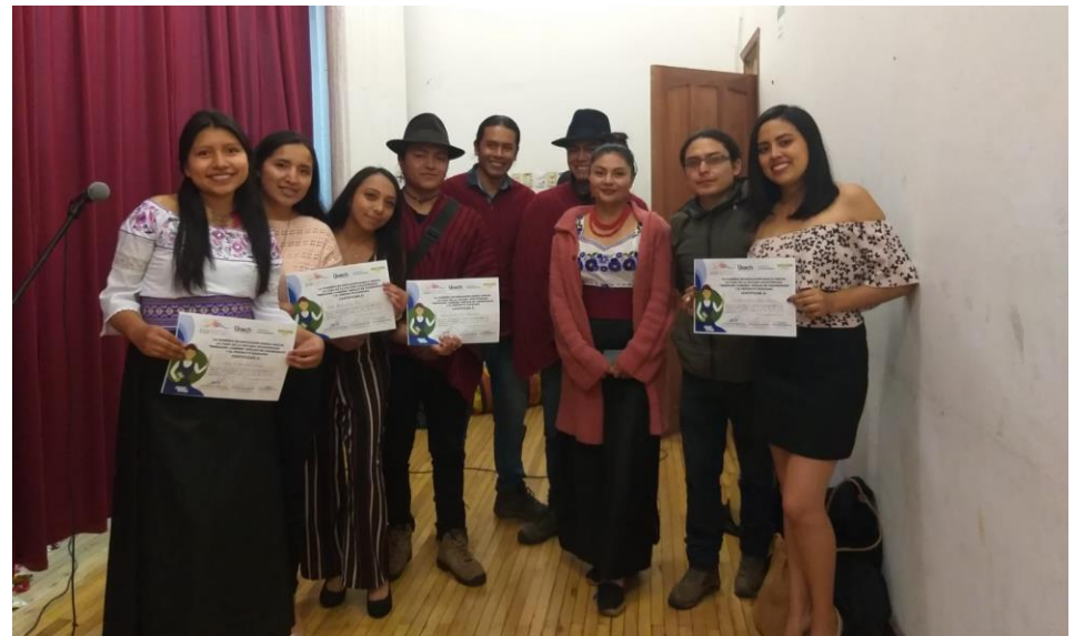
Entrega de certificados